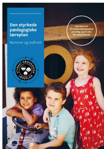
Den styrkede pædagogiske læreplan. Rammer og indhold

Personalet i Klynge B har to gange om året fælles personalemøder, hvor der arbejdes med at opbygge et fælles vidensgrundlag, samt at understøtte faglig sparring. Personalet har forskellige funktioner i de enkelte enheder i forhold til den faglige udvikling, og her arbejdes der også på tværs af Klyngen. Som eksempler kan nævnes: sprognetværk, Kbh. barn netværk, netværk mellem køkkenpersonalet og også de faglige fyrtårne.